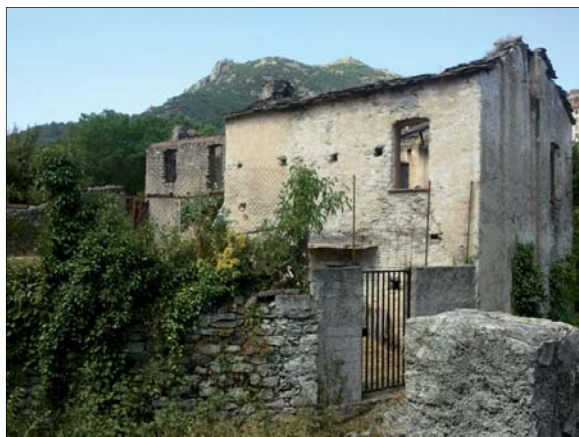
Vue de l'Est