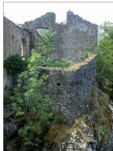
Vue du Nord